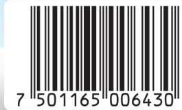
Melox Noche Suspensión 360 ml