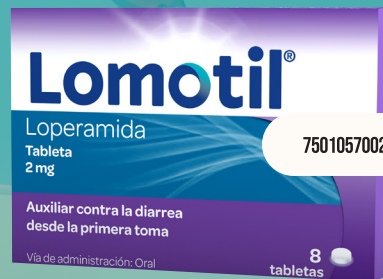
Antidiarréico Lomotil 8 tabletas 2mg c/u