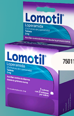
Antidiarréico Lomotil 5 sobres con 2 tabletas c/u