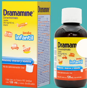
Dramamine Anti Mareo Infantil Jarabe 120 ml

Para prevenir y aliviar mareo, náusea y vómito ocasionados por el movimiento.