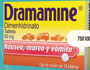
Dramamine Anti Mareo 24 tabs 50 mg c/u