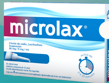
Microlax Enema Laxante 4 piezas con 5 mL c/u

Alivia el estreñimiento ocasional actuando de 5 a 20 minutos.